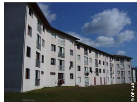
Bâtiments à rénover de l'îlot La Pince (Saint-Paul-lès-Dax)